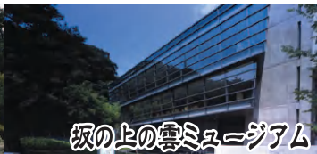
坂の上の雲ミュージアム