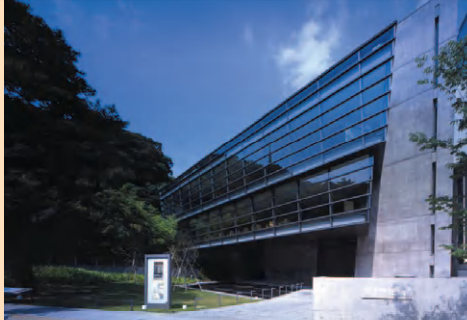
坂の上の雲ミュージアム