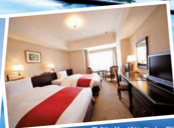
スタンダードツイン(一例)