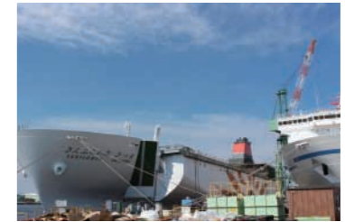
右は商船三井フェリーのさんふらわあさつま

も新造船なら可 能に。 神戸から大分 までスタンダー ドウイズベットル ームで船旅をお 楽しみいただい た後、九州各地 をドライブ観光して、帰りは志布志(鹿児 島)から大阪までデラックスウイズベットル ームで、なんていうフェリーさんふらわあなら ではの旅はいかがでしょう。 その他、バリアフリーエリアが拡充される など、幅広い年代のお客様に船旅を楽しん でいただけるように配慮される他、新型推 進システムの技術によって地球環境にも優し くなります。即ち「人と環境にやさしい次 世代のフェリー」も開発コンセプトの一つです。