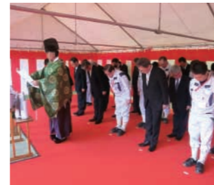
2017年6月19日月 JMU磯子工場 安全祈願祭の様子

只今、神奈川県は横浜市にございます ジャパンマリンユナイテッド株式会社磯子工 場では、2018年に就航いたします新 さんふらわあさつま・新さんふらわあきり しまを建造中です。新造船では現行船以 上に「カジュアルクルーズ」を追求し、さらに 思い出に残る船旅をご提供。 もちろん、大浴場もございますが(現行 船比1.7倍)、全個室に洗面・シャワーが 設置されます。特に、最上級客室である 「スイート」では、バスタブや専用バルコ ニーも設置され、ますます便利で快適 に。神戸大分航路でご好評をいただい ておりますウイズベットルームも新設され、 大切なわんちゃんとお部屋で一緒のご旅行