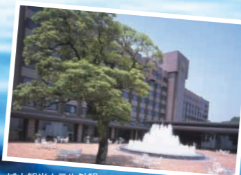
城山観光ホテル外観