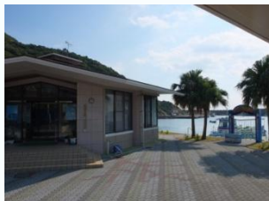
さたでい号発着所にあるレストハウス