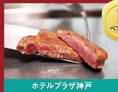
ホテルプラザ神戸

(対象航路) 神戸・大分航路 (お部屋) スタンダード4名様部屋 (お車) 乗船可(人数) 2名様まで