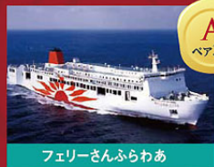
フェリーさんふらわあ