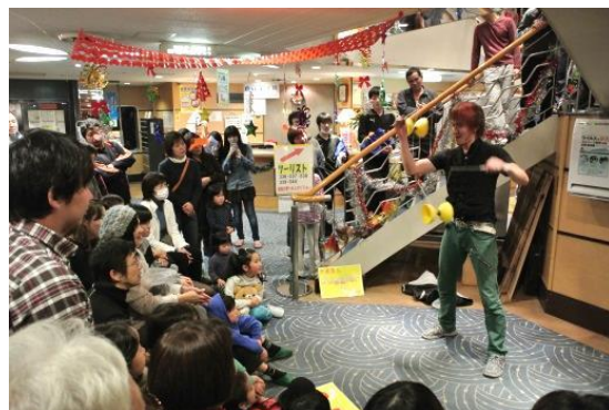
船内イベントの様子