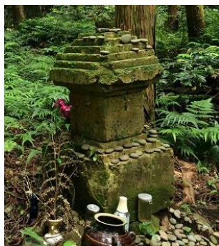
<勇猛果敢と伝わる武将 伝・真田幸村の墓>