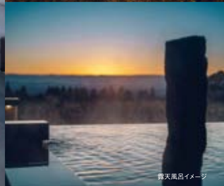
露天風呂イメージ