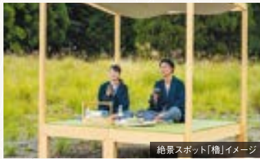
絶景スポット「檜」イメージ