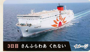
3日目 さんふらわあ くれない イメージ