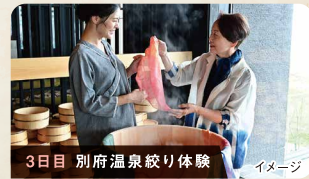
3日目 別府温泉絞り体験 イメージ