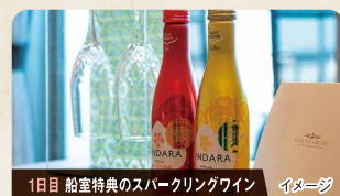
1日目 船室特典のスパークリングワイン イメージ