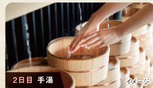
2日目 手湯 イメージ