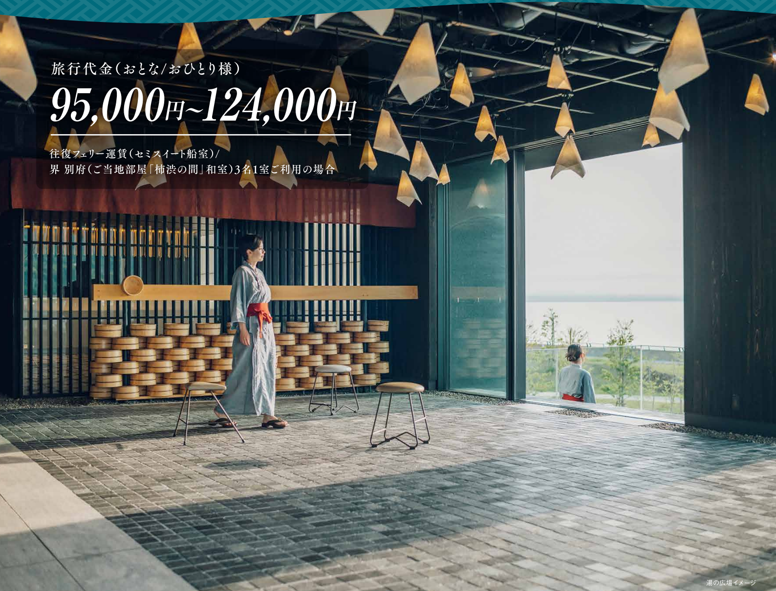
湯の広場イメージ

往復フェリー運賃(セミスイート船室)/ 界 別府(ご当地部屋「楠浜の間」和室)3名1室ご利用の場合