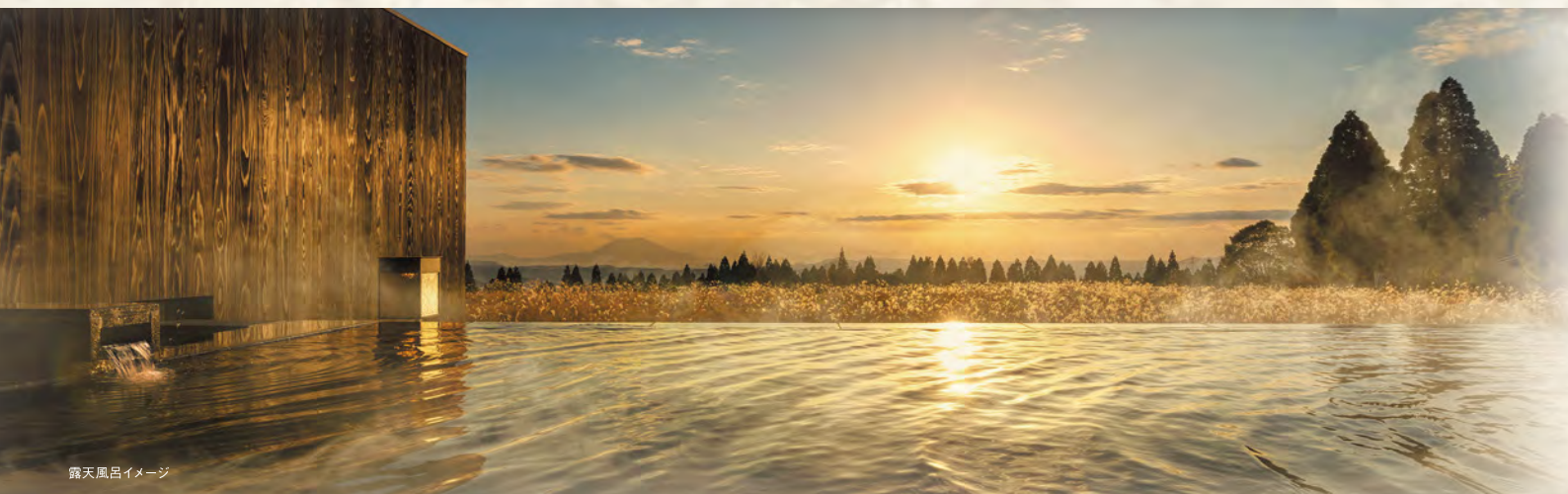
露天風呂イメージ