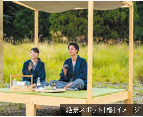
絶景スポット「檜」イメージ