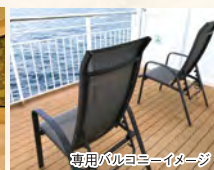
専用バルコニーイメージ

【設備】専用バルコニー・バス・トイレ・洗面台・テレビ・冷蔵庫・電気ケトル・ドライヤー・空気清浄機・ハンガー・ナイトウェア・ティッシュ・ゴミ箱・靴べら・コンセント