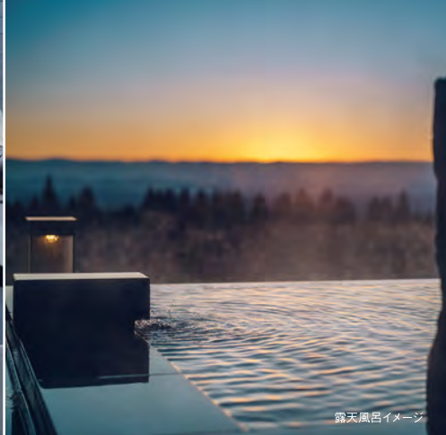
露天風呂イメージ