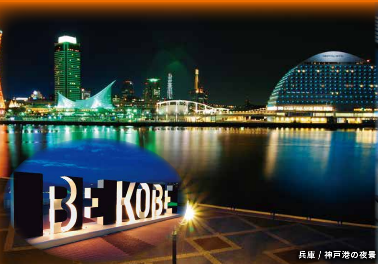
兵庫 / 神戸港の夜景

大阪 | 兵庫 | 京都 | 奈良 | 愛媛 | 高知 | 香川 | 徳島 | 山口 | 広島 | 鳥取