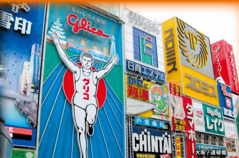
大阪 / 道頓堀