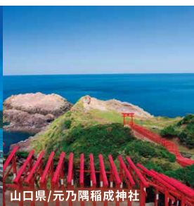
山口県/元乃隅稲成神社