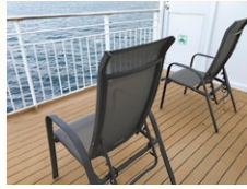
スイートバルコニー

【備品】スリッパ・ロゴ入りタオル・歯ブラシ・ハンドソープ 衣類用消臭スプレー・コップ・バスマット・バスタオル フェイスタオル・シャンプー・コンディショナー ボディソープ・茶器セット・ミネラルウォーター