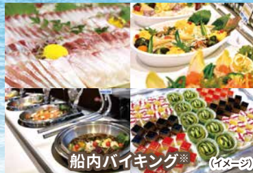
船内バイキング※ (イメージ)