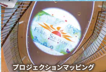
プロジェクションマッピング