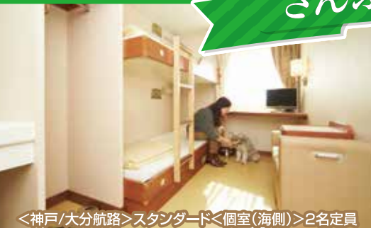
<神戸/大分航路>スタンダード<個室(海側)>2名定員