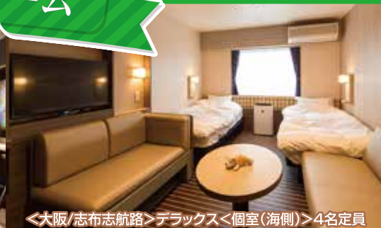
<大阪/志布志航路>デラックス<個室(海側)>4名定員