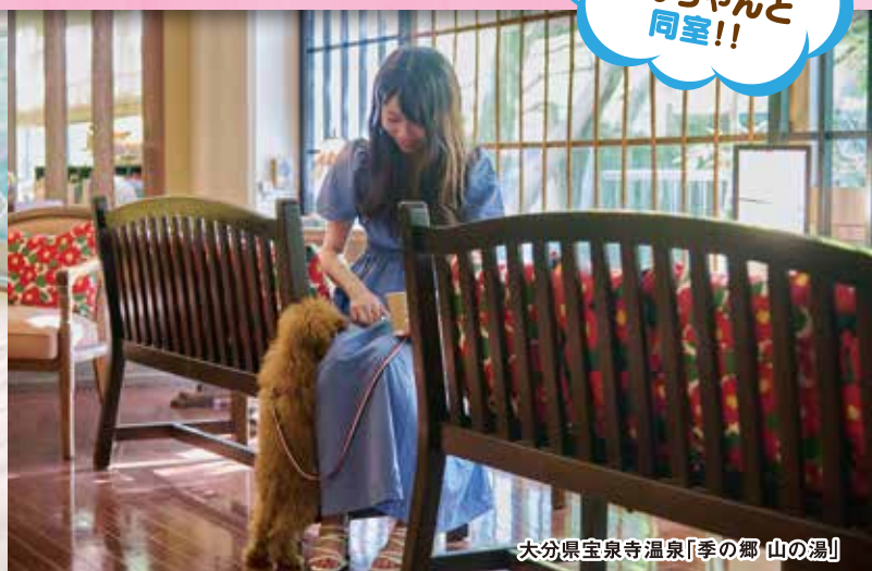
大分県宝泉寺温泉「季の郷 山の湯」