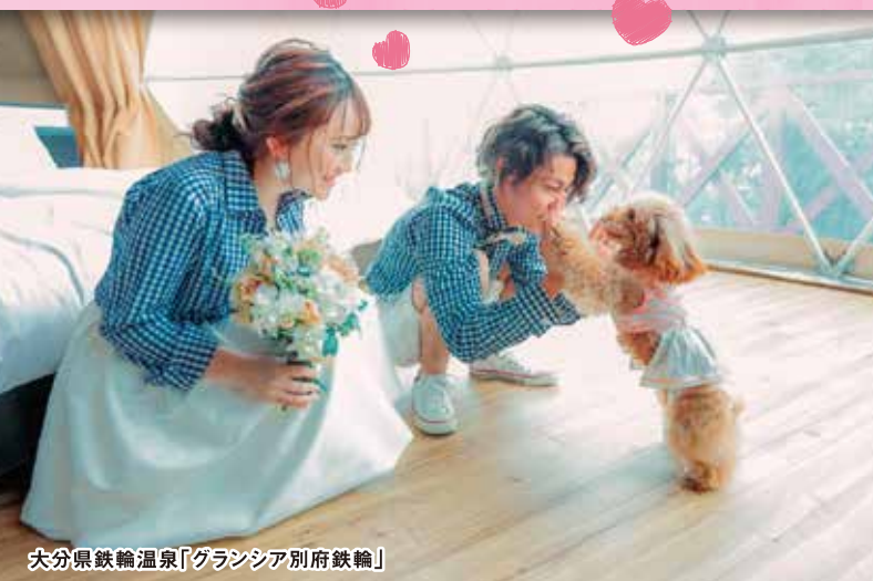
大分県鉄輪温泉「グランシア別府鉄輪」