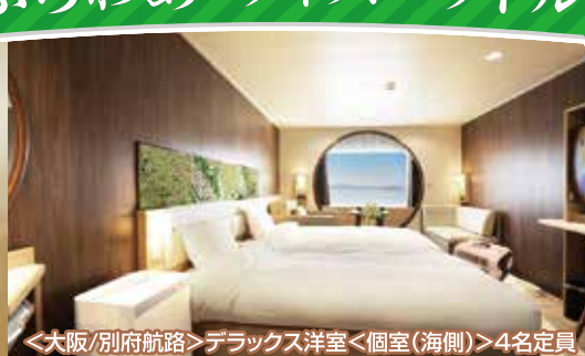
<大阪/別府航路>デラックス洋室<個室(海側)>4名定員