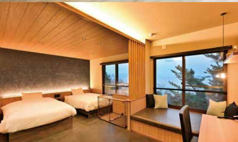
佐賀県唐津市「尾ノ上Ryokan」