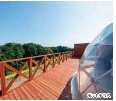
客室風呂(温泉)一例