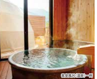
客室風呂(温泉)一例