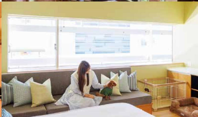
大阪府大阪市 「OMO7大阪ホテル by 星野リゾート」