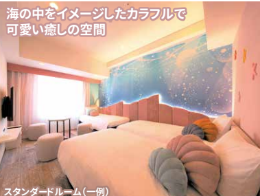
海の中をイメージしたカラフルで 可愛い癒しの空間