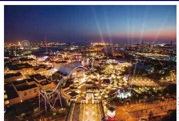
ホテルからの夜景

目の前に広がるパークの夜景！ スタジオビュープラン ■左記カジュアルルーム代金に加算 おひとり様/ おとな・子ども同額 ＋1,500円