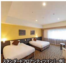
スタンダードフロアシティツイン(一例)