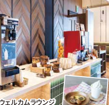
ウェルカムラウンジ