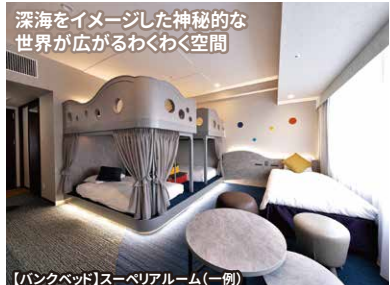
深海をイメージした神秘的な 世界が広がるわくわく空間