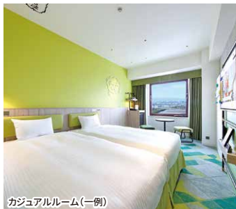
カジュアルルーム(一例)