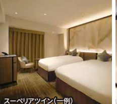
スーベリアツイン(一例)