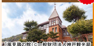
「風見鶏の館」