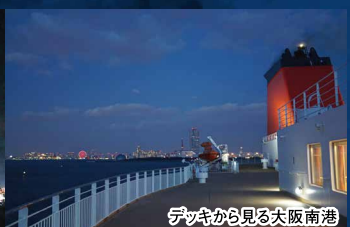
デッキから見る大阪南港