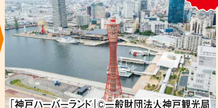
「神戸ハーバーランド」

※モデルコースに記載の観光施設入場料、拝観料、交通費、食事代などは旅行代金に含まれておりません。