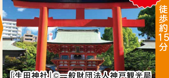
「生田神社」