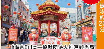
「南京町」◎一般財団法人神戸観光局