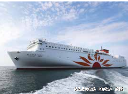
さんふらわあ くれない 外観