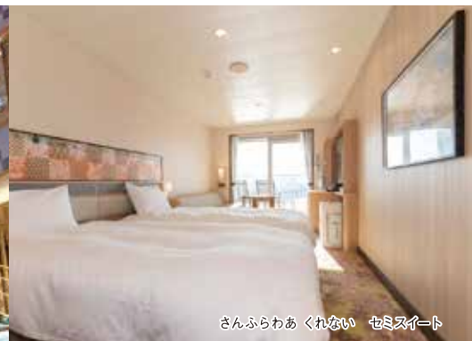
さんふらわあ くれない セミスイート