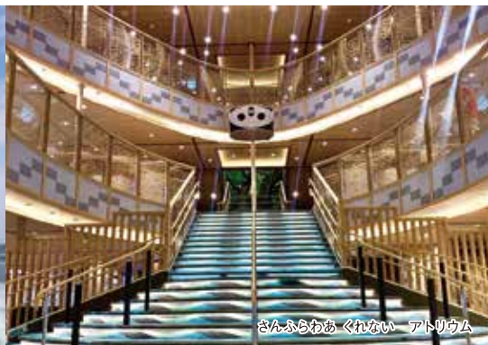
さんふらわあ くれない アトリウム