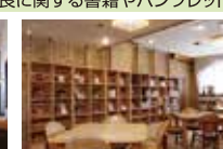
尾花文庫(イメージ)