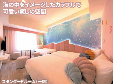
海の中をイメージしたカラフルで 可愛い癒しの空間