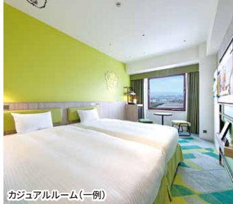
カジュアルルーム(一例)