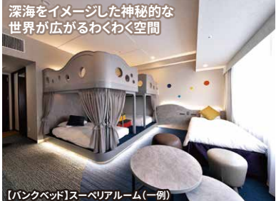
深海をイメージした神秘的な 世界が広がるわくわく空間