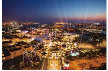
ホテルからの夜景