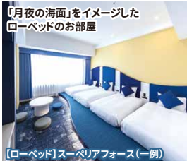
『月夜の海面』をイメージした ローベッドのお部屋