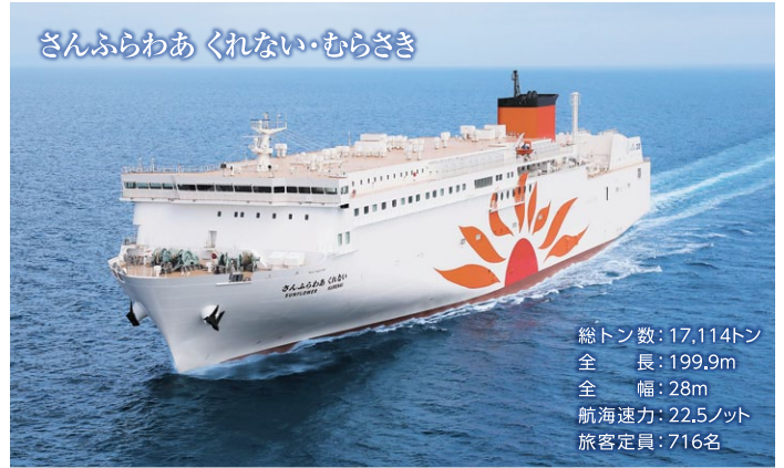
さんふらわあ くれない・むらさき

総トン数：17,114トン 全長：199.9m 全幅：28m 航海速度：22.5ノット 旅客定員：716名