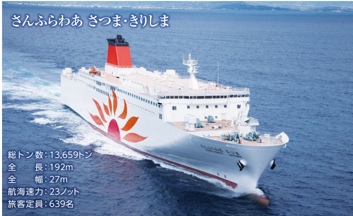
さんふらわあ さつま・きりしま

総トン数：13,659トン 全長：192m 全幅：27m 航海速度：23ノット 旅客定員：639名