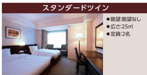
スタンダードツイン