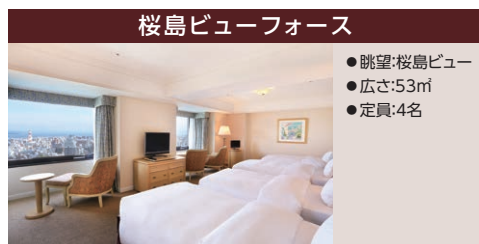
桜島ビューフォース