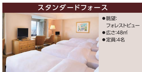
スタンダードフォース