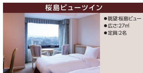
桜島ビューツイン