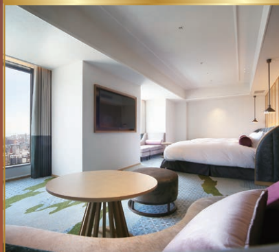
眺望:桜島ビュー 広さ:54㎡ 定員:2名