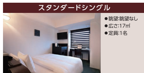
スタンダードシングル