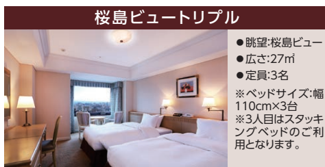
桜島ビュートリプル