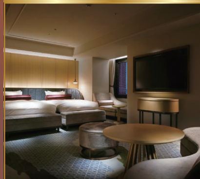
眺望:フォレストビュー 広さ:50㎡ 定員:3名