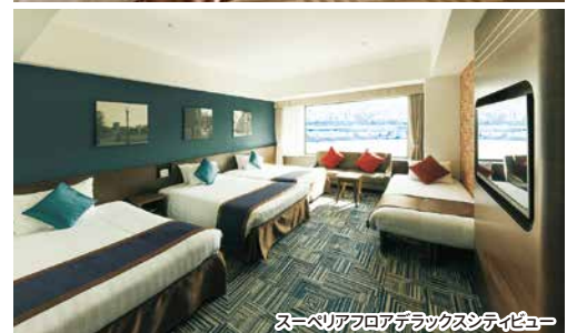
スーペリアフロアデラックスシティビュー