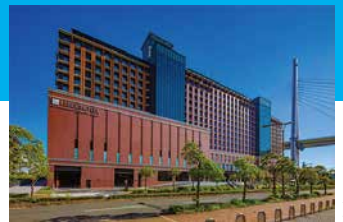
ボルト・マウント

訪れた瞬間から非日常へと誘う洗練された空間。 今までにない、ワンランク上のホテルステイをお楽しみください