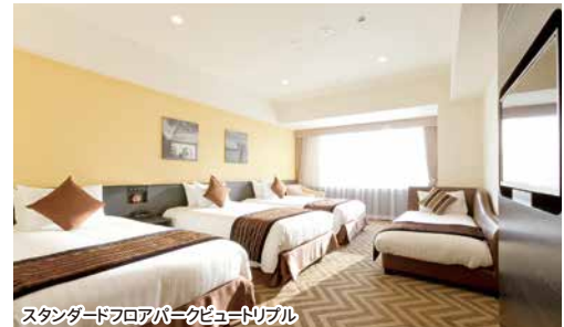
スタンダードフロアパークビューダブル