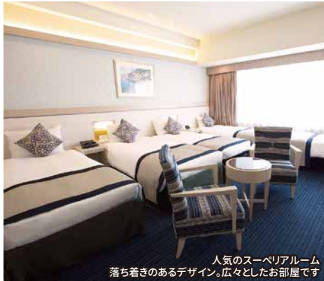
人気のスーペリアルーム 落ち着いたデザイン。広々としたお部屋です