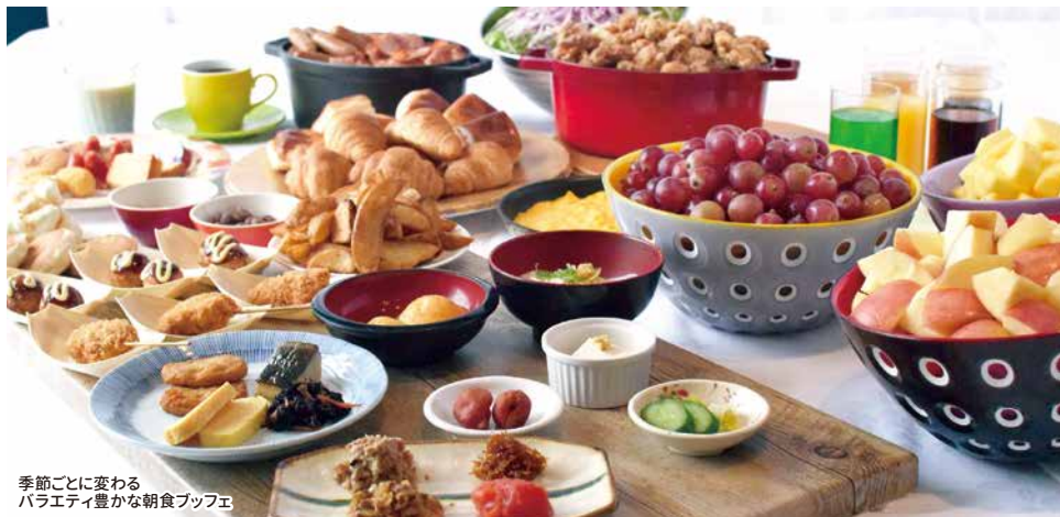
季節ごとに変わる バラエティ豊かな朝食ブッフェ