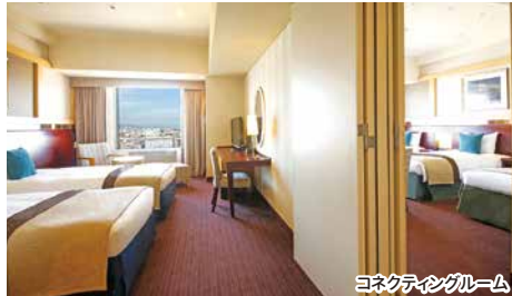
コネクティングルーム