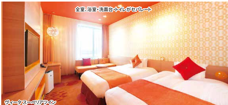
全室、浴室・洗面台・トイレがセパレート