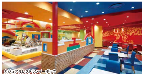
カジュアルレストランライボック