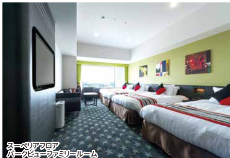
スーペリアフロア パークビューファミリールーム