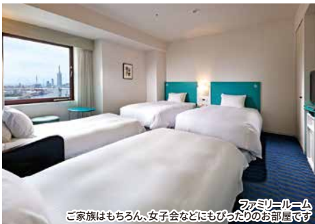
ファミリールーム ご家族はもちろん、女子会などにもぴったりのお部屋です