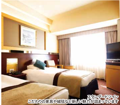
スタンダードツイン こだわりの家具や絨毯など新しい魅力が詰まっています

パークまでは徒歩すぐ、駅は目の前の好立地。 トレイル・バスがセパレートになったスーペリアルームが人気です。