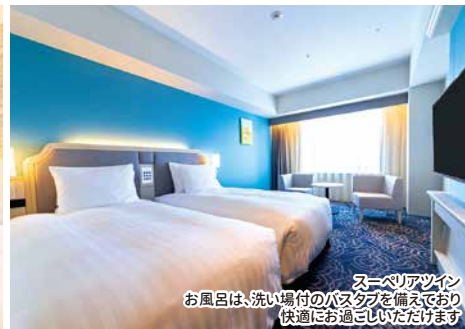
スーペリアツイン お風呂は、洗い場付のバスタブを備えており 快適にお過ごしいただけます