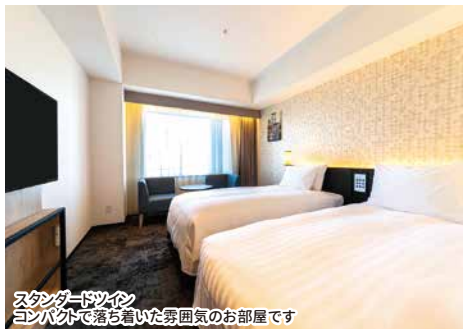
スタンダードツイン コンパクトで落ち着いた雰囲気のお部屋です