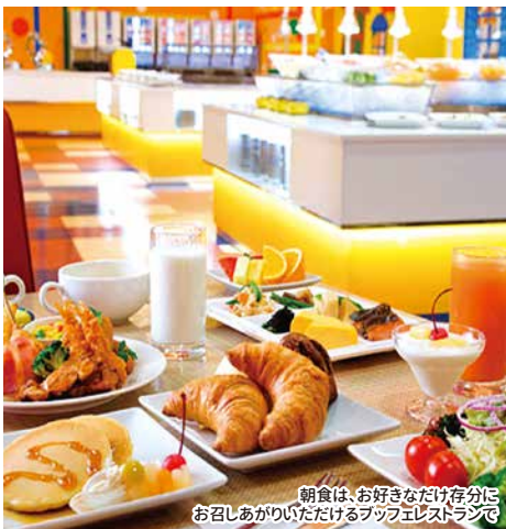
朝食は、お好きなだけ存分に お召しあがりいただけるbuffetレストランです