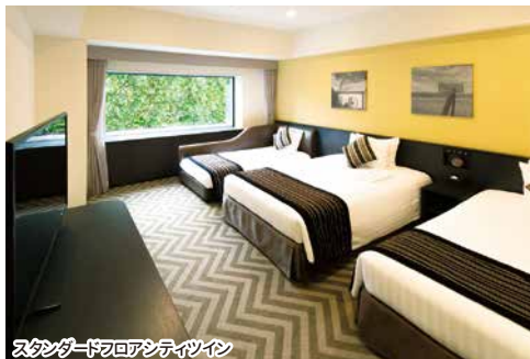
スタンダードフロアシティツイン