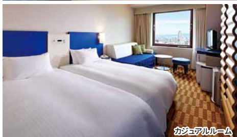
カジュアルルーム