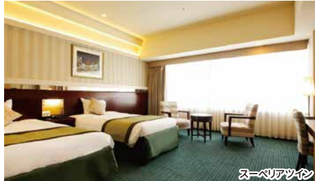
スーペリアルーム