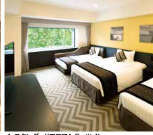
▲スタンダードフロアシティツイン