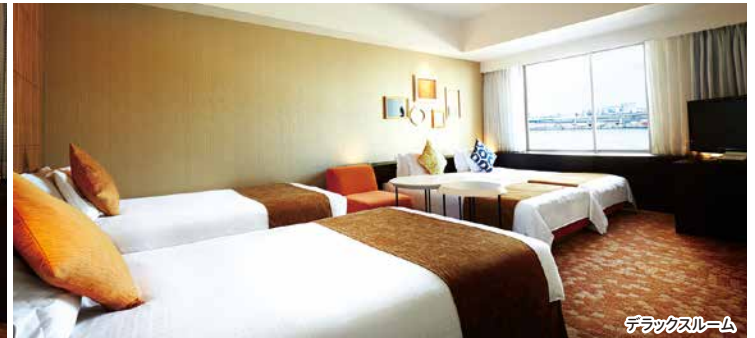
デラックスルーム