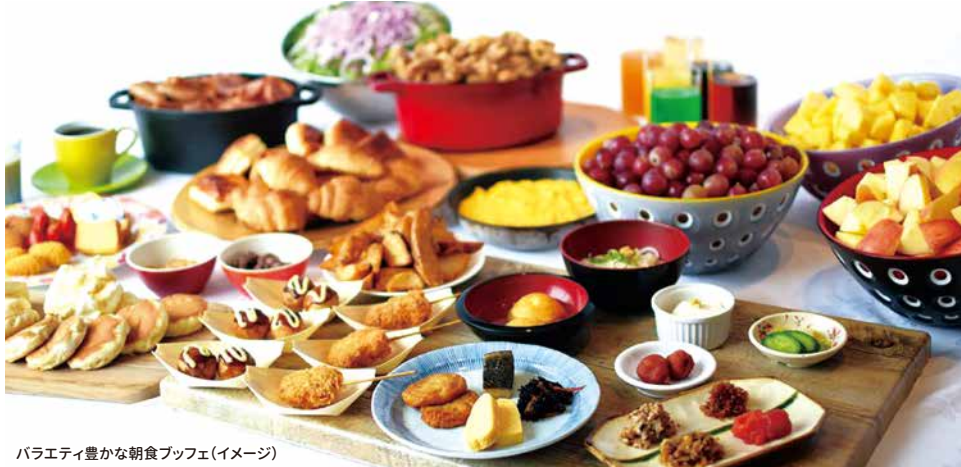
バラエティ豊かな朝食ブッフェ(イメージ)