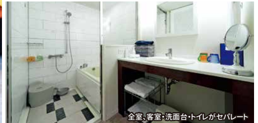
全室、客室・洗面台・トイレがセパレート

※I・Jシーズンは割引除外日 ※Hシーズンは早割60・45は割引除外日となります