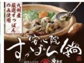
2日目昼食/やまさ旅館 すっぽん鍋