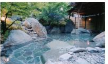
こがね山荘の露天風呂