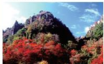
深耶馬溪 一目八景