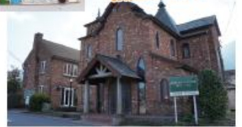
由布院ステンドグラス美術館