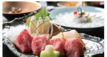
2日目昼食/豊後牛しゃぶしゃぶ懐石