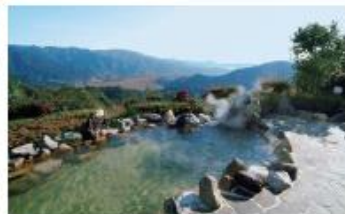
ジゼイ寺 日南 露天風呂