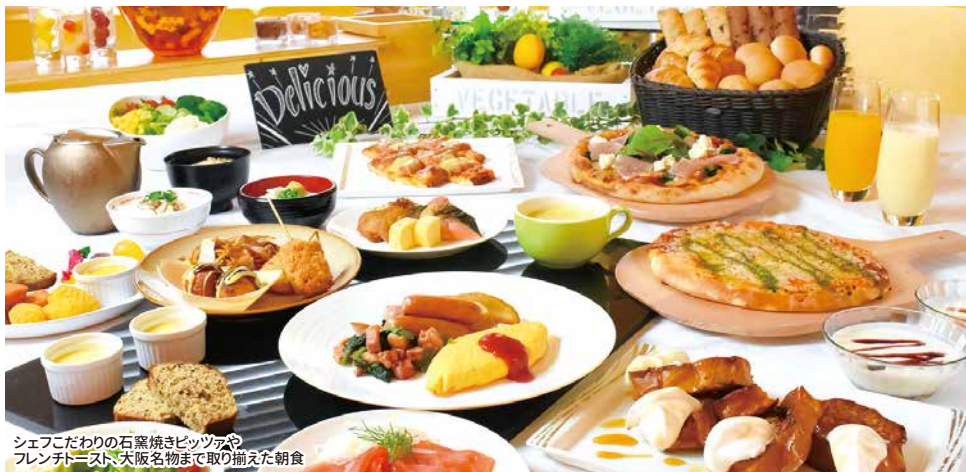
シェフこだわりの石窯焼きピッツアや フレンチミスト、大阪名物まで取り揃えた朝食

デュベ仕様のお布団とふかふかのマットレス、バス・トイレセパレートなど心地よい滞在を提供いたします