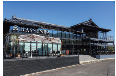
カフェやショップを併設し、2階ではバーも営業予定。人吉観光の新たな拠点としてにぎわいを生み出している