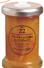
ブラッドオレンジと桃のコンフィチュール1190円