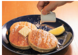
人気メニューの九州パンケーキ900円。宮崎県高岡町のはちみつと高千穂発酵バターを使用したシンプルなおいしさ