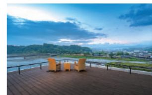
7階「天空のテラス」は球磨川を一望できる絶景スポット

創業者が掘り当てた「鮎里源泉」が注ぐ。人吉温泉はとろりとした炭酸水素塩泉で「美人の湯」として知られる