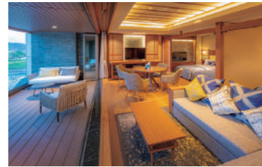
「スパスイート・パノラマビュー」の客室。自家源泉露天風呂を備えた贅沢な空間