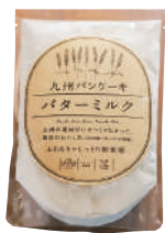
パンケーキミックス540円。九州産バター・ミルクパウダーを使用