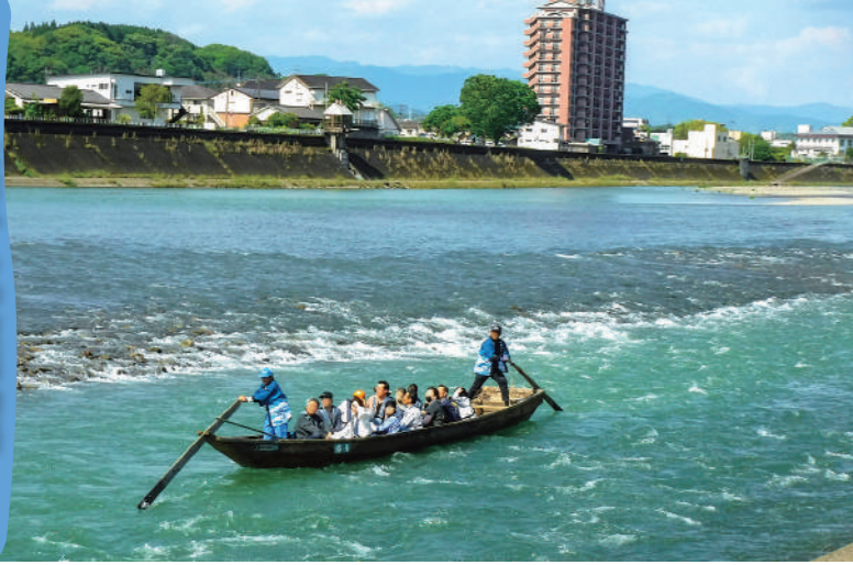
春は桜、初夏の新緑、秋は紅葉と人吉の四季を楽しめる「梅花の渡し」。4～10月はラフティングも開催