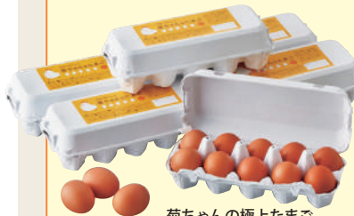
菊ちゃんの極上たまご10個入り

●たまごのきくちゃん ☎0993-83-2122 〔南九州市〕MAP P12B3 「菊永エッグファーム」で育った新鮮な朝採れ卵の直売所。開聞岳を望む茶畑に囲まれた地で育つニワトリに、ミネラル豊富な麦飯石配合のエサを与え、コクと旨みのある濃厚な味わいに。全国への発送OK！卵のほか、たまごサンドやプリンなども販売している。