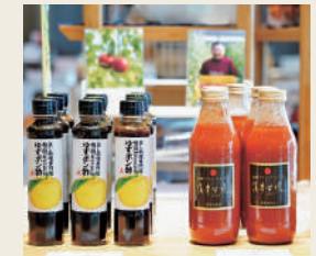
店オリジナルのゆずポン酢などご当地グルメを販売

④南九州市知覧町17375-1 ⑤志布志港から車で2時間 ⑥11～14時 ⑦水曜 ⑧25台