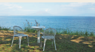
テラス席ではワンちゃんと一緒にピッツアやホットドッグなどのカフェメニューが楽しめる

炭焼きハンバーグ150g&鹿児島県産黒毛和牛サーロインステーキセット 4500円 柔らかいサーロインとの欲張りセット。ハンバーグはミディアムがおすすめ