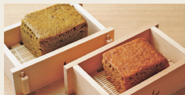
旬蒸ふくれ各400円 もりんがみるく（左）と黒糖（右）

大隅半島と薩摩半島の名物グルメをご紹介します！ 山海の幸に恵まれた鹿児島の郷土料理から銘酒まで、 とことん堪能しよう！