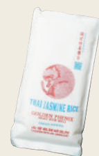
ジャスミン ライス648円