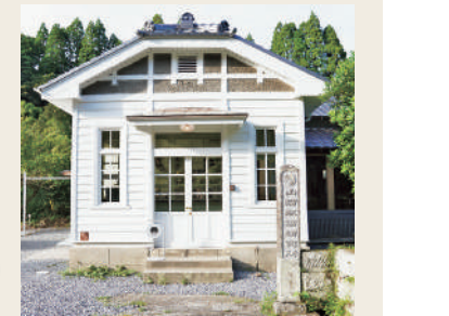
築100年のレトロな付まい

④枕崎市金山町722 ⑤志布志港から車で2時間20分 ⑥宿泊は1日1組1万5000円※3名まで ⑦12～16時LO（完全予約制） ⑧不定休 ⑨11台