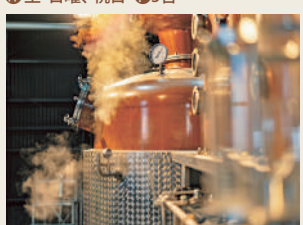
近年は同蔵内の「菱田蒸溜所」でウイスキー事業を開始

●てんせいしゅぞう ☎099-477-0510 〔大崎町〕MAP P12D2 明治34年（1901）創業、大崎町で100年以上の歴史を重ねる蔵元。国産サツマイモと清らかな超軟水の地下水を仕込みに使い、香り豊かで飲み口のやさしい芋焼酎を造り続けている。 ④大崎町菱田1270 ⑤志布志港から車で15分 ⑥9～16時（工場見学は要相談） ⑦土・日曜、祝日 ⑧5台