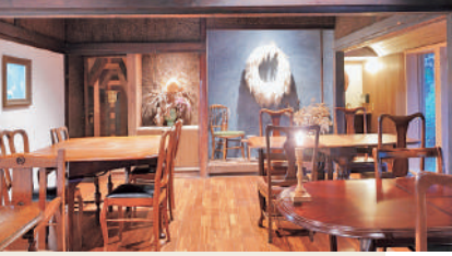
奥には寝室があり、一日一組限定の宿としても営業