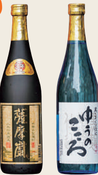
蔵元が受け継ぐ技と水が生んだ自慢の銘酒