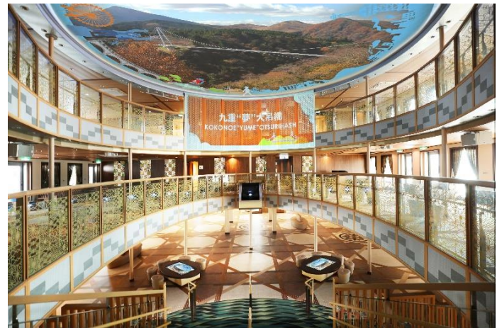
▲壁面スクリーンにも投影されます

アトリウムの天井には、プロジェクションマッピングを投影します。投影に使用するのは、船への搭載では 世界初 ※となるEPSON製高性能プロジェクター（EB-L30000U,超短焦点レンズELPLX03）。同製品の導入により、天井に広く・高画質に投影することが可能となりました。さらに、天井だけでなく壁面スクリーンを使用した広範囲のプロジェクションマッピングをお楽しみいただけます。