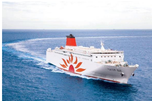
さんふらわあきりしま

本イベントは海象・気象状況および新型コロナウイルス感染症等その他の状況により、時間・内容の変更または中止の場合があります。また、雨天時は星空講座のみ実施し、星空観測会は中止となる場合があります。あらかじめご了承の程お願い申し上げます。