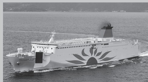
就航船舶 さんふらわあ さつま (総トン数13,659ト 全長192m 巾27.0m)