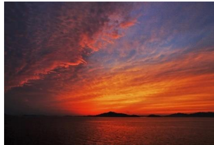
▲瀬戸内海の風景(イメージ)