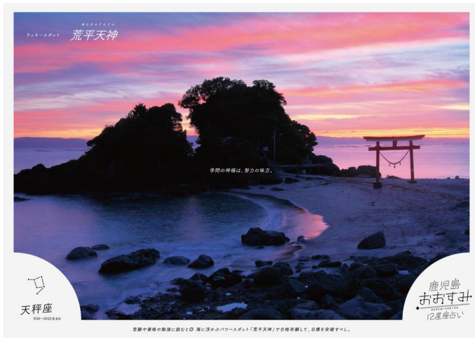
荒平天神: 海に突き出た島のような岩山上(天神島)に神社が建立されている風光明媚な場所です。絶景の夕日が望めるパワースポットです。