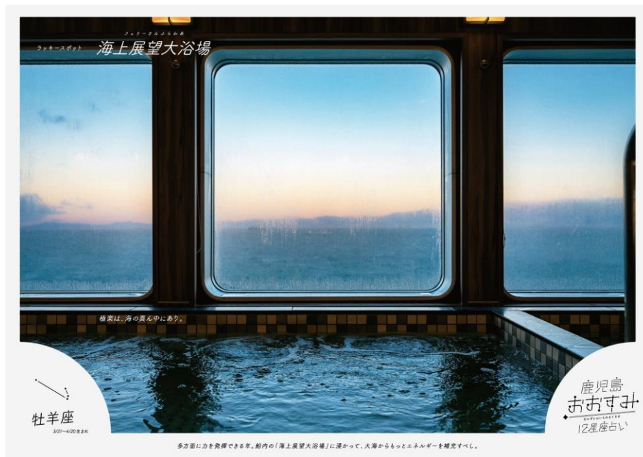
フェリーさんふらわあ 展望大浴場：太平洋を一望できる大浴場で、疲れをゆったり洗い流せます。