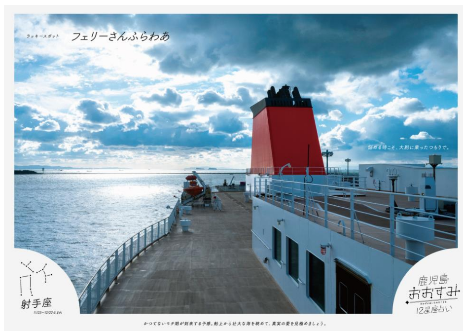
フェリーさんふらわあ 船上からの景色：開放的なデッキから眺める夕陽や朝日、満天の星空は絶景です！