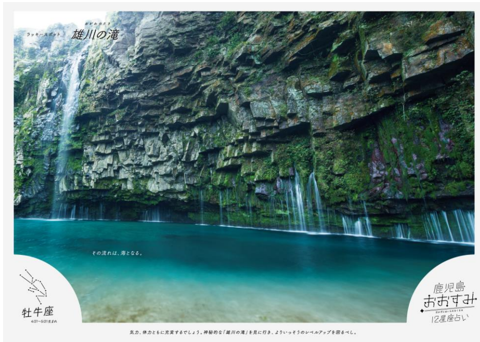
雄川の滝: エメラルドグリーンの滝壺が美しい、溪流の音に癒されながら自然と一体になれる癒しのスポットです。