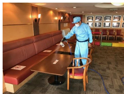
▲パブリックスペース 施工風景