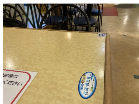
▲施工後 レストラン ステッカー掲示