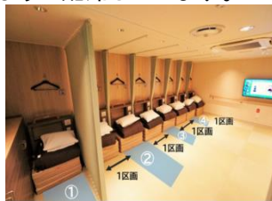
▲ツーリストの配席例(左:大阪/別府航路 右:大阪/志布志航路)