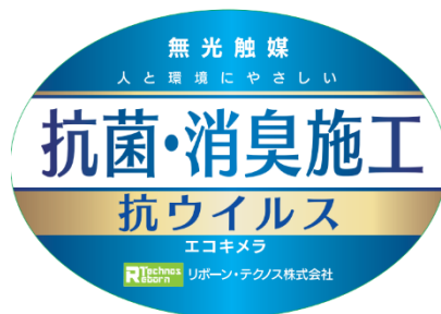
▲掲出用ステッカー