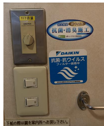
▲船室 ステッカー掲出例