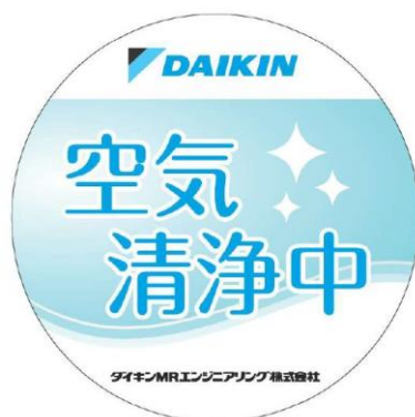
▲掲出用ステッカー