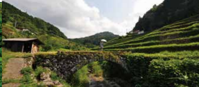
大分県宇佐市院内町余谷