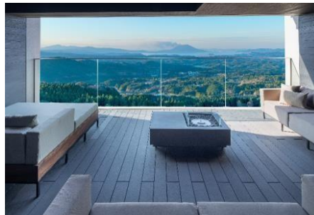
界 霧島のビューテラス