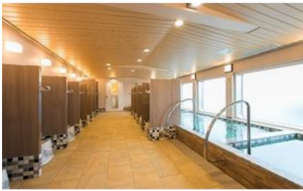
さんふらわあ 大浴場

「さんふらわあ」では、水平線から昇る朝日を浴びながら大浴場での湯浴み、船上ヨガ体験などを楽しむことができます。また、「界 霧島」では、チェックイン後に、移動で疲れた体力を回復させる食べる甘酒を用意します。夕食は、鹿児島県の伝統工芸品である薩摩焼や龍門司焼きなどの器で提供される、地域ならではの旬の素材をいかした会席料理を堪能できます。そして、泉質に合った入浴法のレクチャーをする「温泉いろは」や温泉ストレッチなどで入浴効果を高め、酢を使用した湯上がりドリンクで水分補給。絶景を眺め、温泉に浸かり、心身ともにリフレッシュしパワーチャージすることができます。