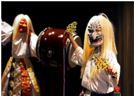
ご当地楽「天孫降臨 ENBU」