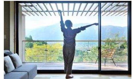
界の温泉ストレッチ（イメージ）