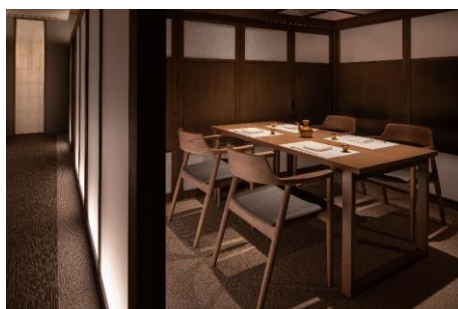
界 霧島 半個室の食事処