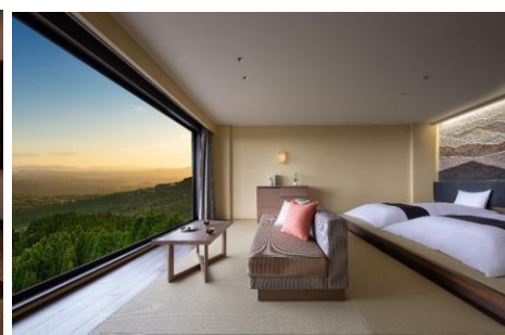
界 霧島 ご当地部屋