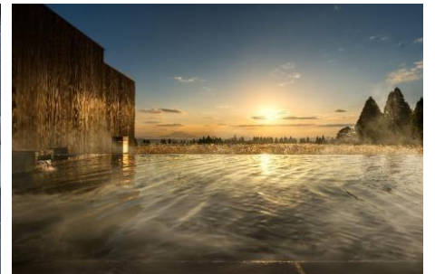
界 霧島の露天風呂