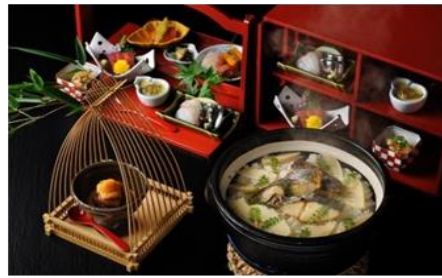
界 霧島の会席料理