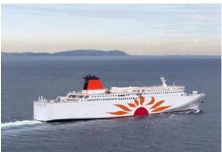
絶景を眺めるさんふらわあ

「さんふらわあ」では、満天の星空を眺めながら開催される星空教室や、二日目早朝には水平線からの日の出や野生の馬が生息する都井岬など、さまざまな絶景を眺めることができます。「界 霧島」では、施設のあらゆるところから桜島や錦江湾など目の前に広がる雄大な景色を望めます。また、すすき野原に佇む湯浴み小屋からはさわやかな風を感じ、夕日が沈む情景を眺めながら湯浴みを堪能し、パワーチャージができます。