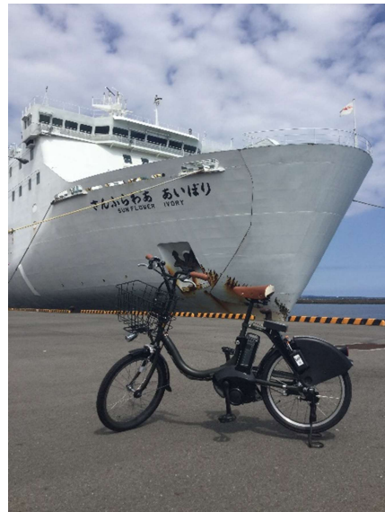
さんふらわあと電動アシスト自転車