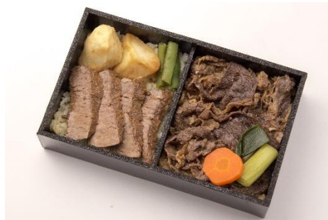
#神戸エール飯 淡路屋 神戸のすきやきとステーキ弁当

エール飯の準備が整い次第、順次販売開始となるため、7/10時点で販売していないメニューがございます。