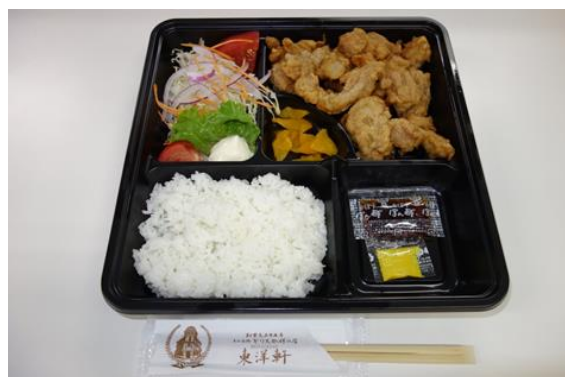
#別府エール飯 東洋軒 本家とり天弁当