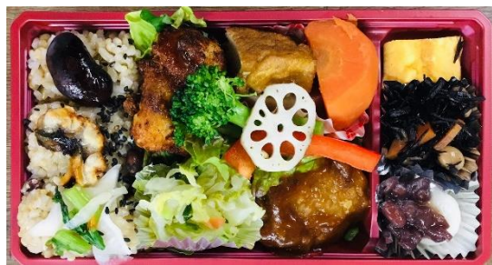
#別府エール飯 元喜玄氣 季節の元喜弁当