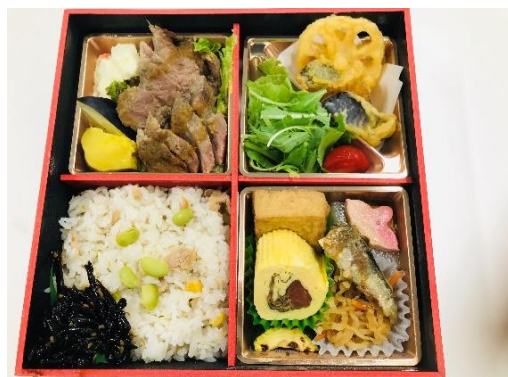
#大阪エール飯 野菜家 菜苑 特選牛ステーキ膳