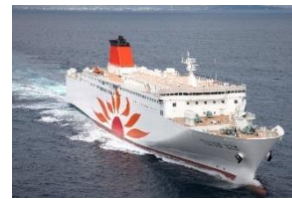
さんふらわあ さつま・きりしま 大阪⇄志布志

大洗⇄苫小牧航路は商船三井フェリーが、その他3航路はフェリーさんふらわあが運航します。