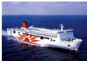
さんふらわあ ごーど・ぱーる 神戸⇄大分