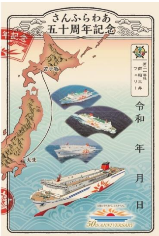
商船三井フェリー 御船印