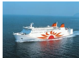
さんふらわあ あいぼり・こぼると 大阪⇄別府