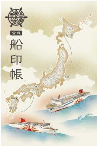
公式船印帳デザイン