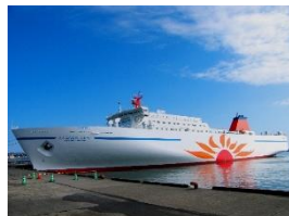
さんふらわあ しれとこ・だいせつ 大洗⇄苫小牧