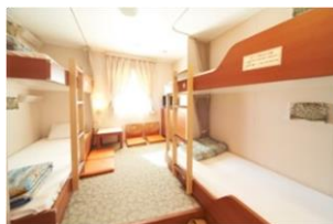
スタンダードルーム4名

入港後、翌日の朝まで船内でご宿泊いただけるサービスです。 なお、ご宿泊いただいたお客様は、大浴場もご利用いただけます。