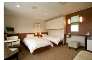
デラックスルーム