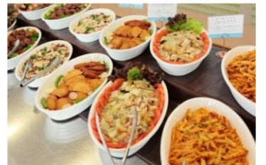
夕食バイキング(イメージ)