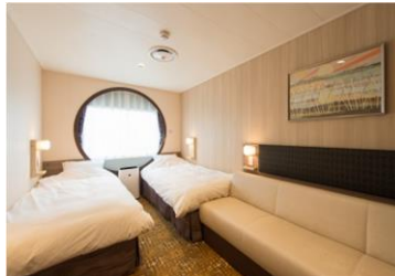
デラックスルーム