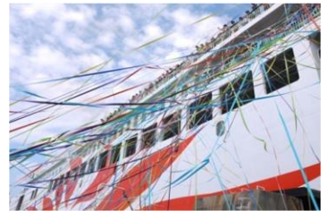
出港時のテープセレモニー(イメージ)

○お食事: 船旅の楽しみの一つである「お食事」については、昼食・夕食ともに「昼の瀬戸内感動クルーズ」特別メニューをご用意いたします。