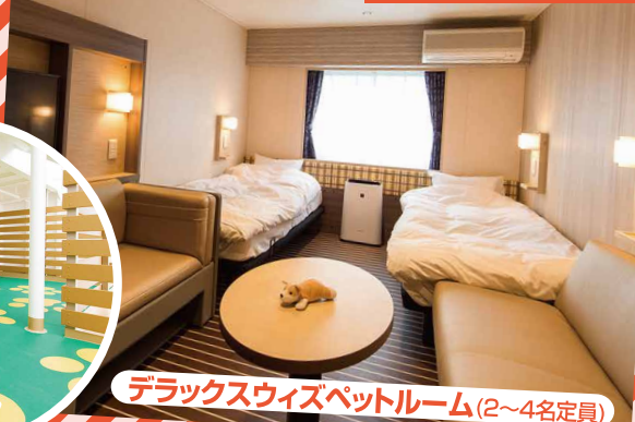
デラックスウイズペットルーム (2~4名定員)