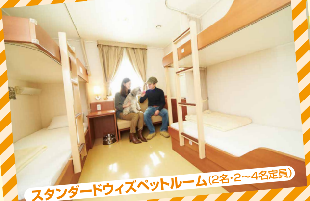
スタンダードウイズペットルーム (2名・2~4名定員)