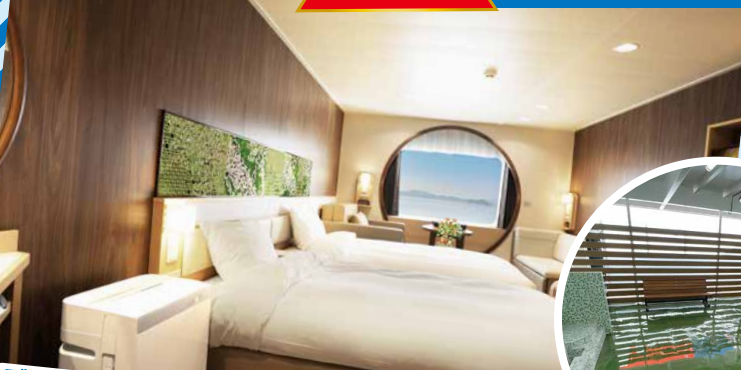
デラックスウイズペットルーム (2~4名定員)