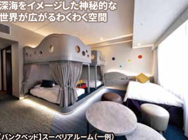
【バンクベッド】スーパーリアルーム(一例)

リニューアル客室 疲れを癒し、ゆっくり休める「居心地のいい空間」がコンセプトの新客室