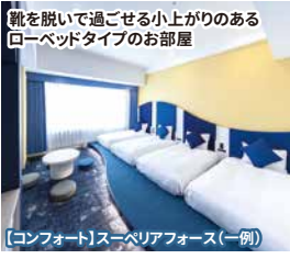
【コンフォート】スーパーフォース(一例)

リニューアル客室 疲れを癒し、ゆっくり休める「居心地のいい空間」がコンセプトの新客室