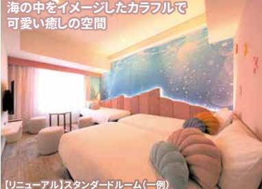
【リニューアル】スタンダードルーム(一例)