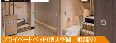
プライベートベッド(個人空間/相部屋)