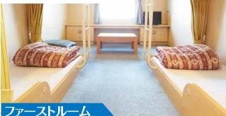
ファーストルーム

開放的な空間と、船室の窓からは夜景や朝焼けを見る事が出来ます! 4名様個室(窓・TV・洗面台付き)