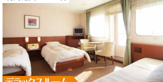
デラックスルーム

バス(シャワー)・トイレを完備した窓付きの客室です。瀬戸内や太平洋のさわやかな潮風に吹かれながら快適な船旅をお楽しみください。デラックスルームは専用バルコニー付です! ※3~4名利用の場合補助ベッド使用