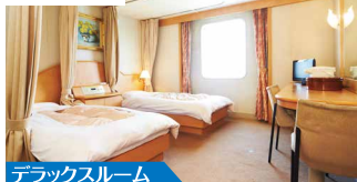
デラックスルーム

大阪南港⇄別府観光港のデラックスルームです。ゆったりとした個室のお部屋で快適な船旅をお楽しみください。2名様個室(窓・TV・洗面台・バス・トイレ付き)