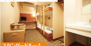
スタンダードルーム

1名様でも気軽にご利用頂けるシングルルームを完備。2名様コンパクトな個室、3~4名様でご利用頂ける個室は窓がついてご家族やご友人旅行におすすです!