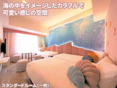
スタンダードルーム(一例)