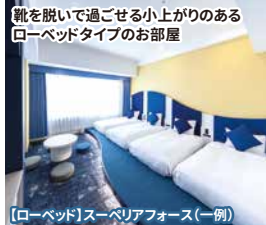
【ローベッド】スーペリアフォース(一例)