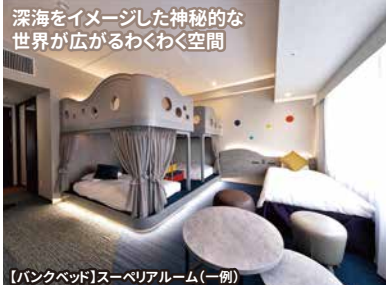
【バンクベッド】スーペリアルーム(一例)