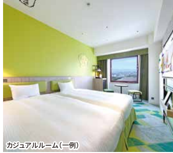
カジュアルルーム(一例)