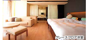
グレースフロア洋室