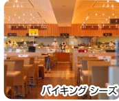
バイキングシーズ

お食事は握りたて、揚げたて、作りたての美味しさにこだわった和・洋・中約80種類の品揃え。