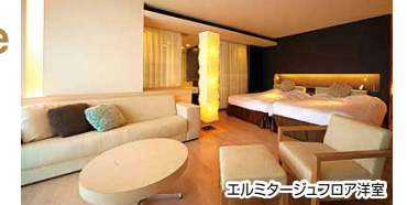
エルミタージュフロア洋室