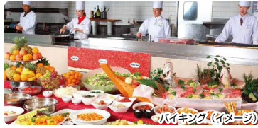
バイキング(イメージ)