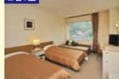
部屋タイプ 本館：山側洋室