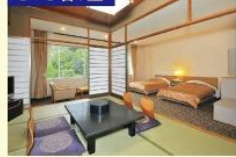
部屋タイプ 本館：山側和洋室