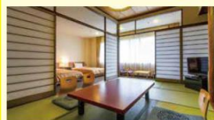
部屋タイプ 本館：山側和洋室