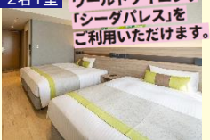
部屋タイプ 虹館：ツインルーム