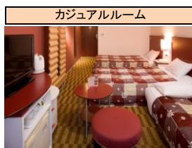
※客室写真はイメージです。