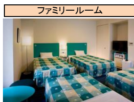
※客室写真はイメージです。