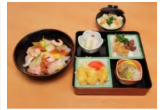
週末限定の定食 『くれない』