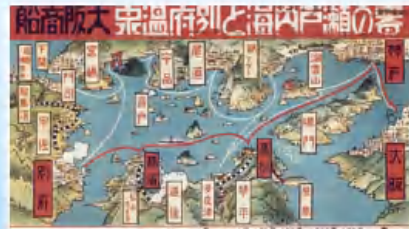
古(いにしえ)の航路図

1912年5月に阪神・別府航路は開設され、2012年5月に100周年を迎えます。これを記念いたしまして、大正末期から昭和初期にかけて製作された旅情あふれるポスターの数々 また、初代からの船体を切手の形にいたしました。「山は富士、海は瀬戸内、道は別府」当時から語られていた航路を影った懐かしい作風の数々と、100年を経て、旅マップ・瀬戸内を走る白い船体をご覧いただき「船に泊まろう。」フェリーさんふらわあの船旅を今後ともお楽しみください。