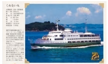
「くれない丸」記念ポストカード