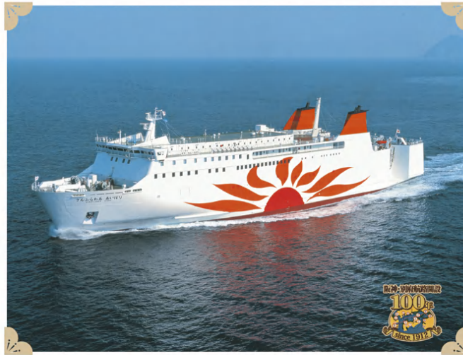
阪神・別府航路開設100年記念 思い出の船.7

主要航路：大阪-別府航路 総トン数：9,245.00t 進 水：平成9年 造船所：三菱-下関 長 さ：153.00m 幅 尺：25.00m 吃 水：. m 航海速度：22.40ノット 旅客定員：710名