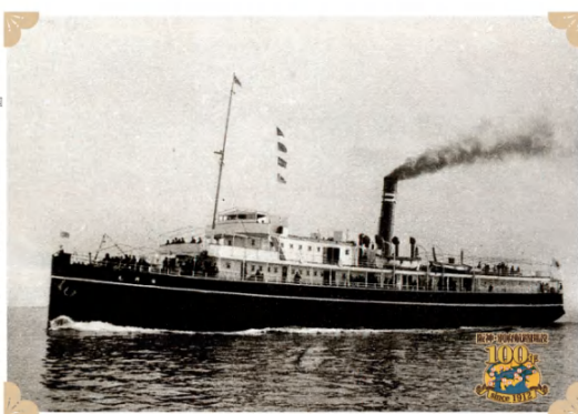
阪神・別府航路開設100年記念 思い出の船.0

前身は北ドイツ・ロイド社の揚子江航路客船美羅(Meishun)。1911年大阪南船に売却され、三菱神戸造船所で改装。瀬戸内海航路初代紅丸として、1912年5月に新設された別府航路に就航した。1921年には別府航路用客船丸の竣工に伴い、阪神船隻間に転配。次いで1924年2代目丸の完成に際し、船名も改称した。瀬戸内海航路の女王として着目、乗客より多大な好評を博し、航路発展の礎となった。