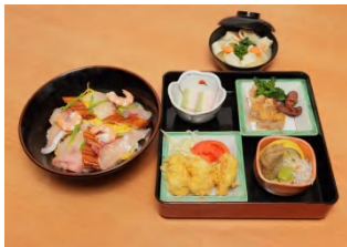
週末限定の定食『くれない』

フェリーさんふらわあは、100年記念キャンペーン中は次に掲げるグッズ販売や特別メニュー提供により、平素より実施中の「船に泊まろう。」キャンペーンを更に押し進めて船旅の楽しさを追求致します。