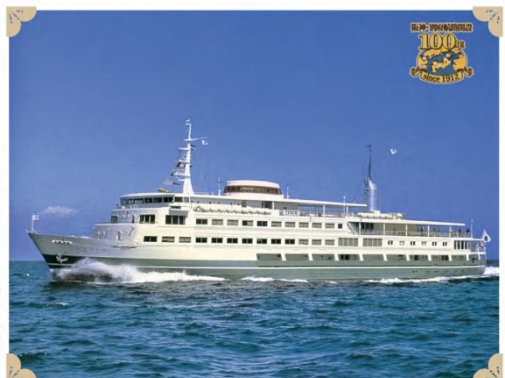
阪神・別府航路開設100年記念 思い出の船.6

昭和56年正月、神社参拝遊航船に就航。松山観光港を出て元寇の宮島厳島神社参拝のため宮島港へ、小さい港の小さい規模に5,000トン級の大型客船の規模は多くの参拝客の目を惹き寄せた。夕刻には宮島港を出て、豊前別府へ入港。バスで宇佐神社へ参拝した。厳島神社は海の上であったが宇佐神社は麓と成る為の中、日の出の満ちし時同時に玉砂利を踏んでのお参りは身が引き締まる思いがしたことだろう。