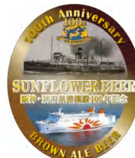
記念地ビールラベル