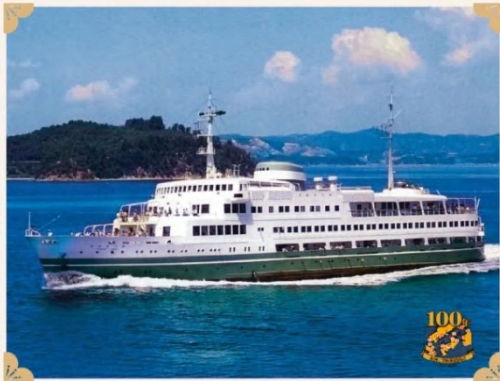
阪神・別府航路開設100年記念 思い出の船.1

瀬戸内海航路観光船のトップバスターとして就航。詳細な接客等の設備をはじめ内装等あらゆる面で最高の技術を採用、内航客船ながら日本の客船を代表する船であった。 船体は、ハーブの藍色のように涼やかな緑色をとり採用された「ハーブ・グリーン」で彩られ、当時としては最高の航海速度18ノットで瀬戸内海を航行した。新婚旅行や盆盆の帰省旅行、外国人観光客からで常に賑わったので、今でも人々の思い出に残っている船である。