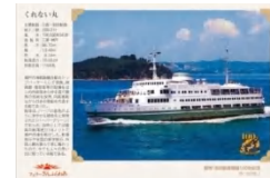
「くれない丸」 ポストカード

大阪～別府航路では、限定の100年特別メニューを提供します。(5月/6月は、「松山もぶり鮓御膳『くれない』 1,500円」「豊後牛ハンバーグセット『むらさき』 1,000円。) 限定メニューをご注文の方には過去に別府航路で活躍した船のポストカードをご乗船の記念品としてプレゼントします。特別記念メニューと当社就航船記念ポストカードは、定期的に変更します。