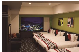
スーパーリアフロア パークビュー ファミリールーム